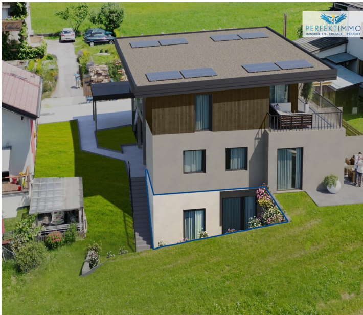
PROJEKT GLETSCHERBLICK SCHÖNBERG